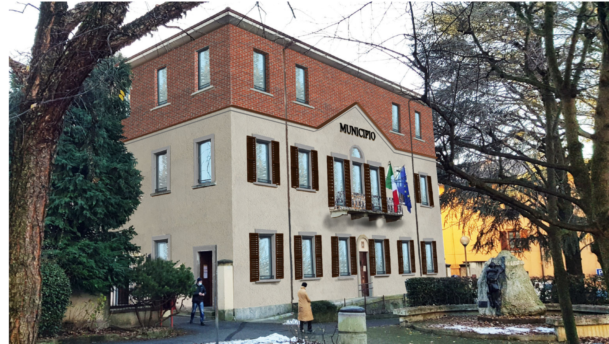
Inserimento fotografico progetto