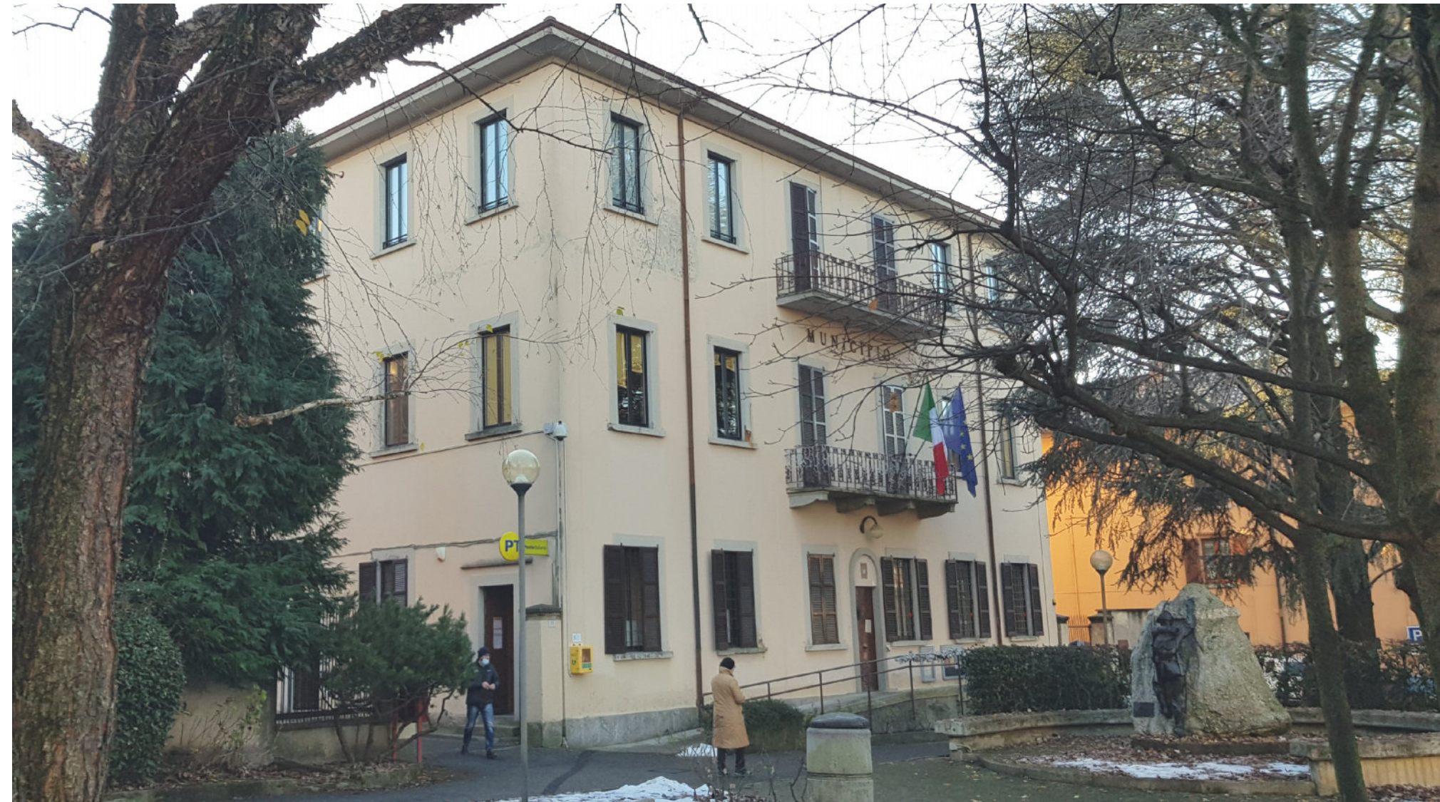
Stato di fatto