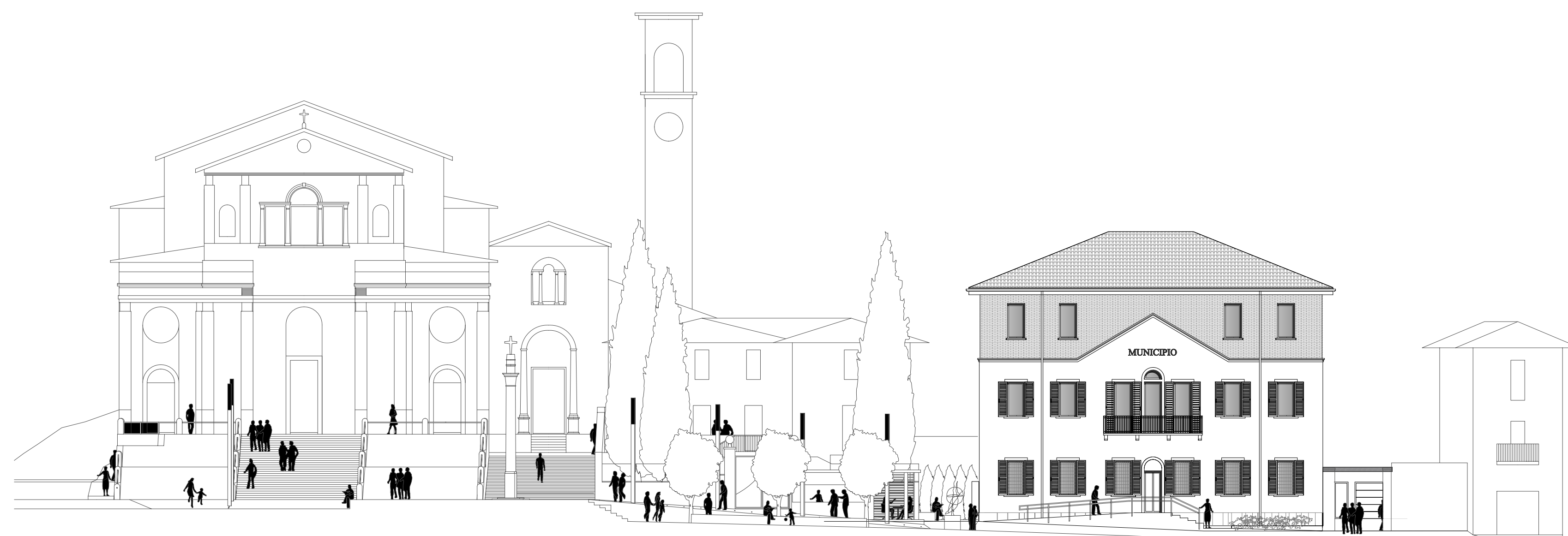
Profilo dell'edificato con facciata di progetto