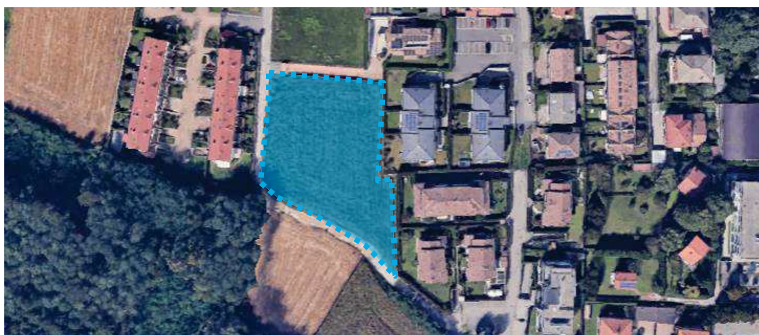
Inquadramento territoriale dell'ambito

La variante consiste nel riconoscimento della possibilità di trasformare la porzione dell'ambito che originariamente era stata destinata a verde di rete ecologica parte in area di concentrazione volumetrica e parte in parcheggio pubblico a servizio del quartiere, come più puntualmente descritto nei capitoli che seguono.