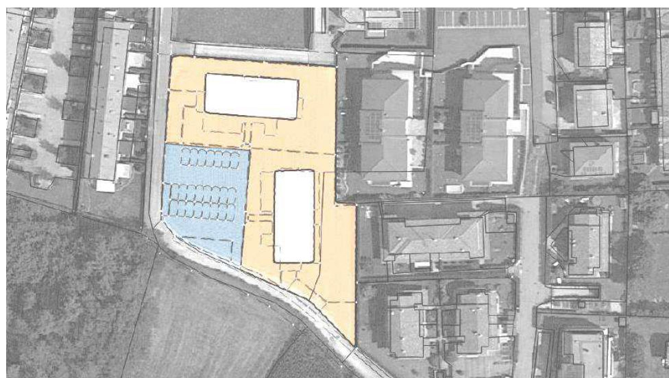
Planimetria di progetto P.A. ATR/8