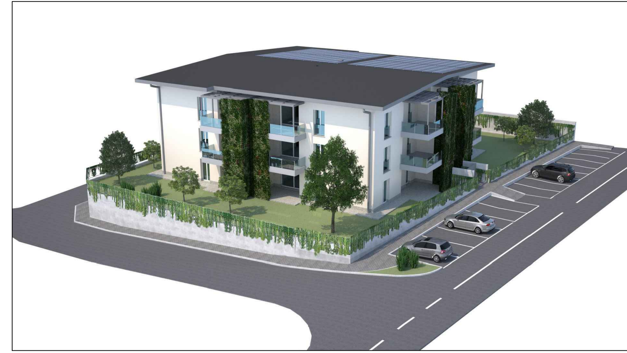
RENDERING DA VIA DIAZ