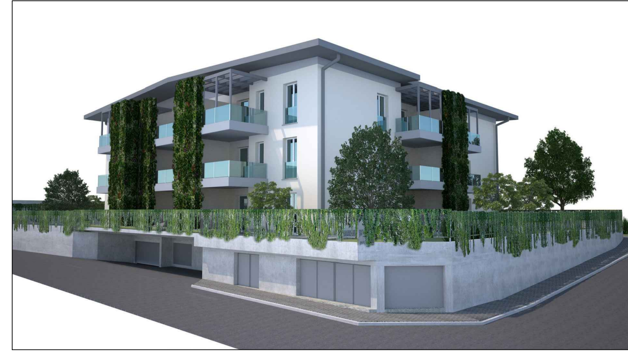
RENDERING DA VIA S. PELLICO