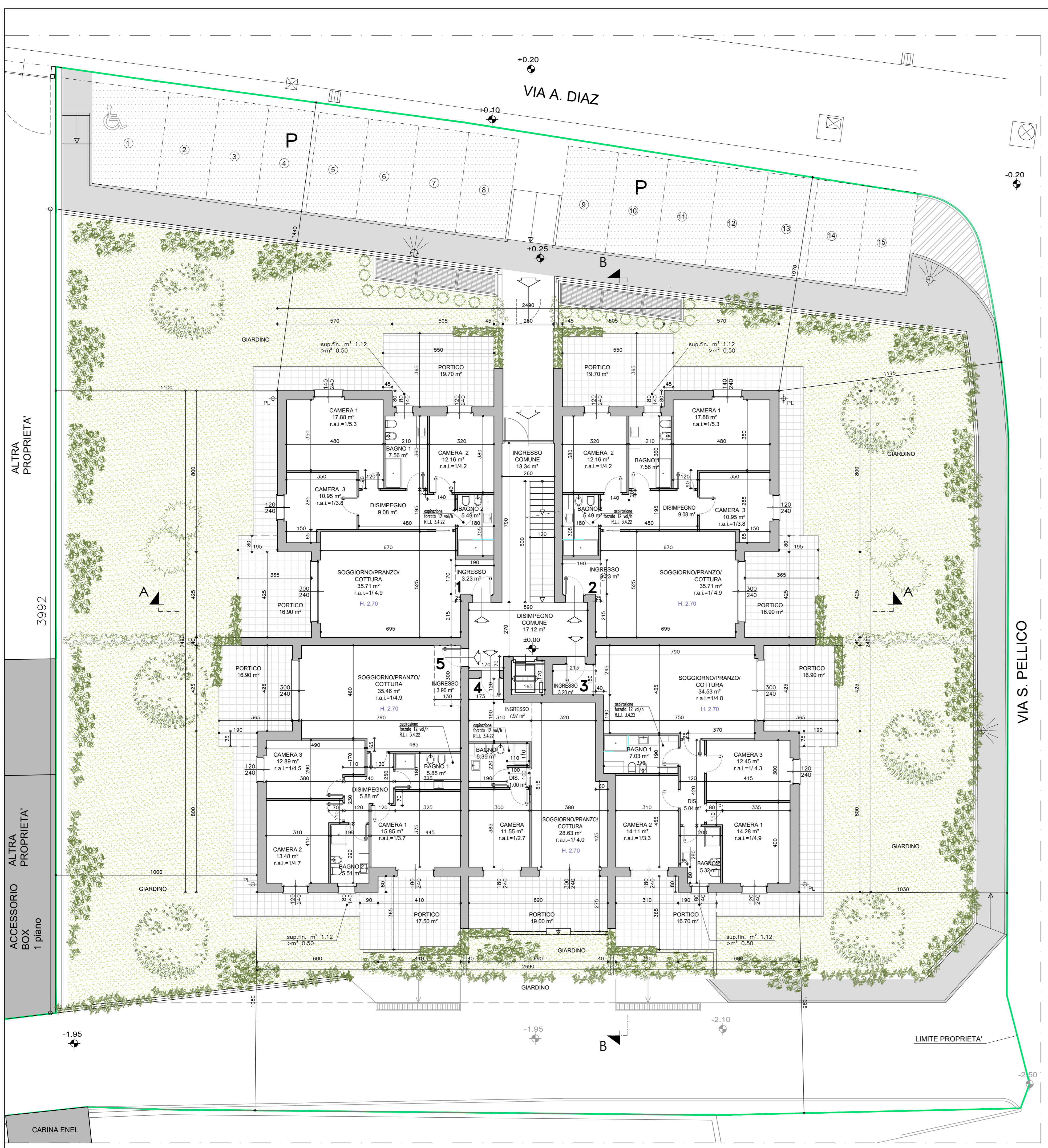
PIANTA PIANO TERRA scala 1:100