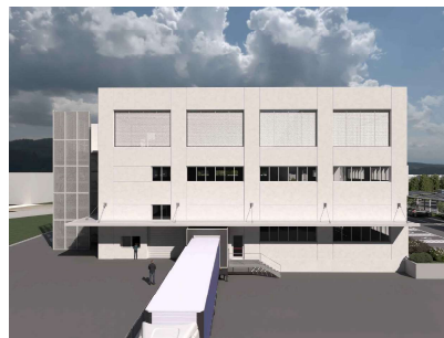
PROSPETTO NORD-OVEST, rendering