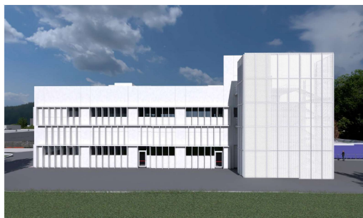
PROSPETTO NORD-EST, rendering