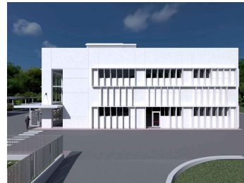
PROSPETTO SUD-EST, rendering