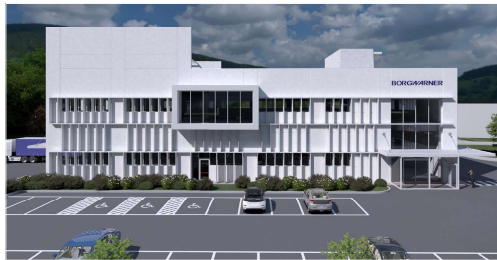
PROSPETTO SUD-OVEST, rendering