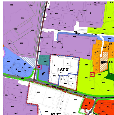
ESTRATTO TAV. 02bPR P.G.T. 1:2.000