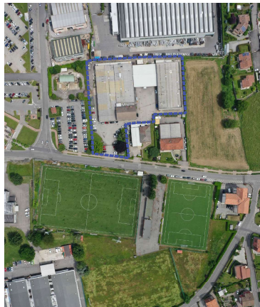
ORTOFOTO AREA B 1:1.500