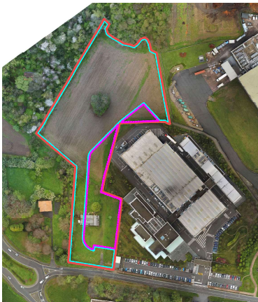
ORTOFOTO AREA A, STRALCI A1 - A2 1:1.500