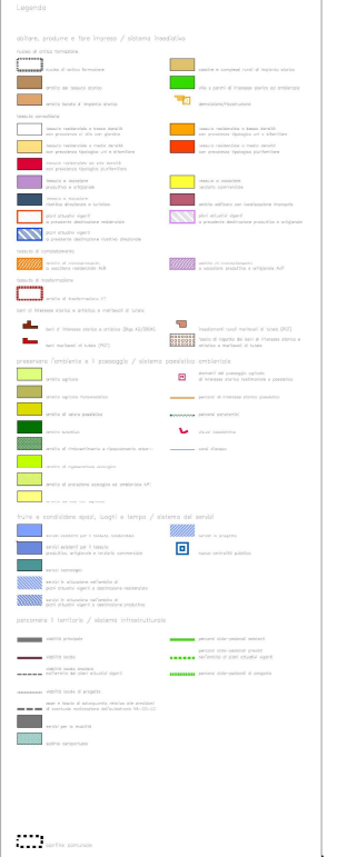
LEGENDA PR P.G.T.