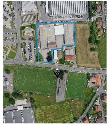
KEYPLAN B) stralzo funzionale Eldor 1