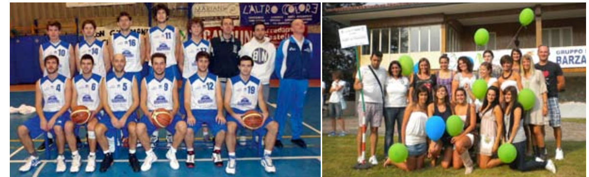
BASKET E PALLAVOLO NIBIONNO 2012