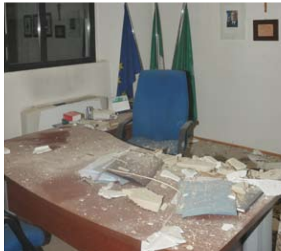
CROLLO DEL SOFFITO DEL PALAZZO COMUNALE

All'inizio del mese di marzo sono stati completati i lavori di manutenzione straordinaria di ripristino del soffitto del palazzo comunale, crollato il 10 novembre scorso. I lavori di ristrutturazione sono stati eseguiti dall'Impresa Edile Morano e Redaelli Luigi Imbiancature che hanno provveduto allo smaltimento dei