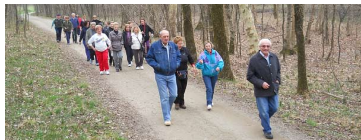
IL GRUPPO IN CAMMINO

WET LIFE in SPOUSPORT benessere e sport - NIBIONNO tel. 031-690501 www.wetlife.net