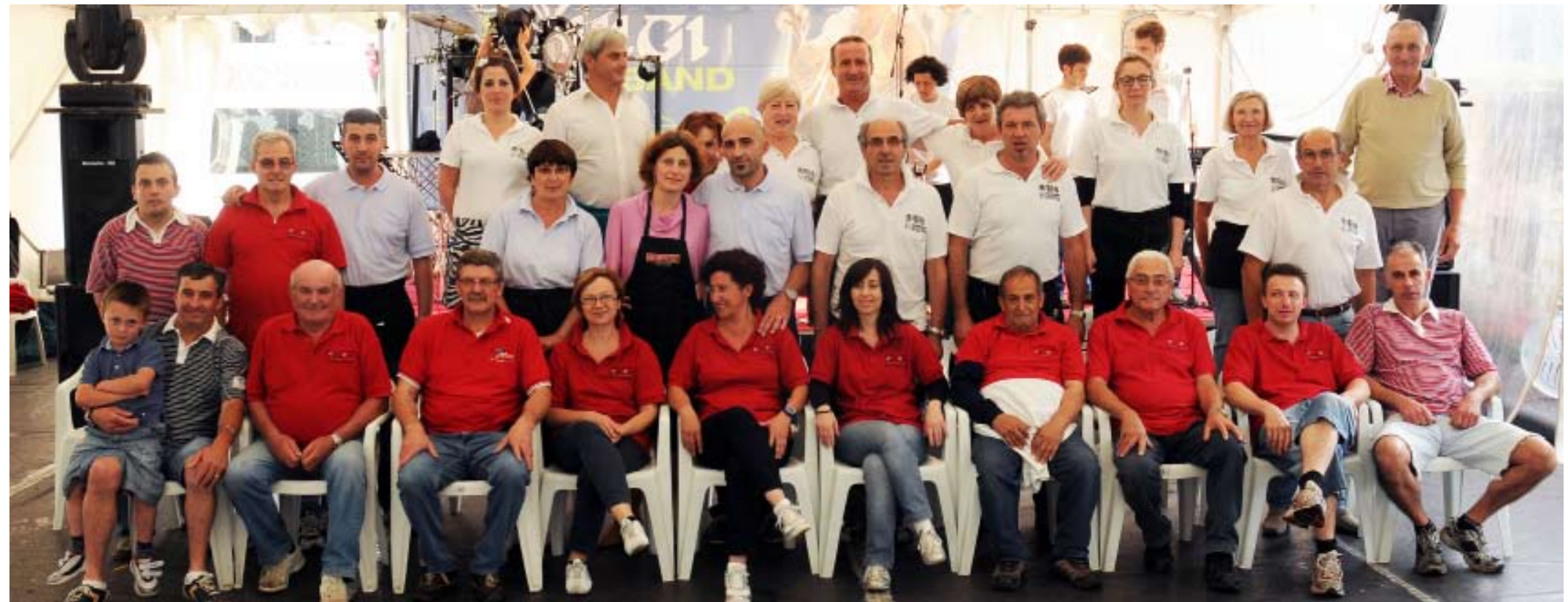
FOTO DI GRUPPO PER I COLLABORATORI DI "I SAPORI DELLA BRIANZA" 2011

A questo proposito posso dire che un altro aspetto importante che mi dà spirito e voglia di organizzare una manifestazione del genere sono le tante persone che mi fermano e mi scrivono per domandarmi quando inizierà la prossima edizione. Non bisogna neanche di-