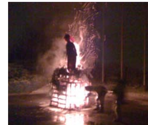
IL MOMENTO CLOU DELLA SERATA

Intorno alle 22,00, dopo un'allegria serata trascorsa insieme, tutti i genitori assieme ai loro bimbi hanno quindi fatto ritorno alle loro case per le strade del paese ammantate dal candore della prima neve.