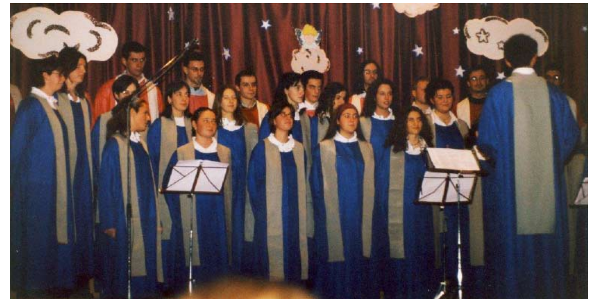
IL CORO "LINEARMONICA" NEI PRIMI ANNI DELLA SUA ATTIVITÀ

Il coro LineArmonica nasce nel 2007 dall'aggregazione di un gruppo di giovani accomu-