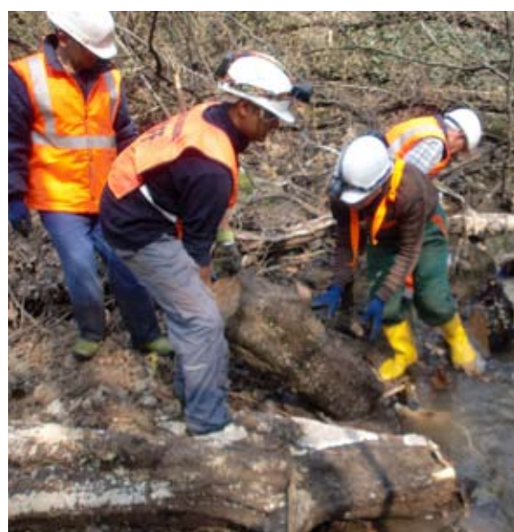
PROTEZIONE CIVILE AL LAVORO

L'attività della Protezione Civile di Nibionno prosegue con "Operazione Fiumi Sicuri" indetta a livello provinciale, con giornate di intervento sui nostri corsi d'acqua per ripulire il greto da piante cadute e rifiuti che non permettono il regolare deflusso delle acque.