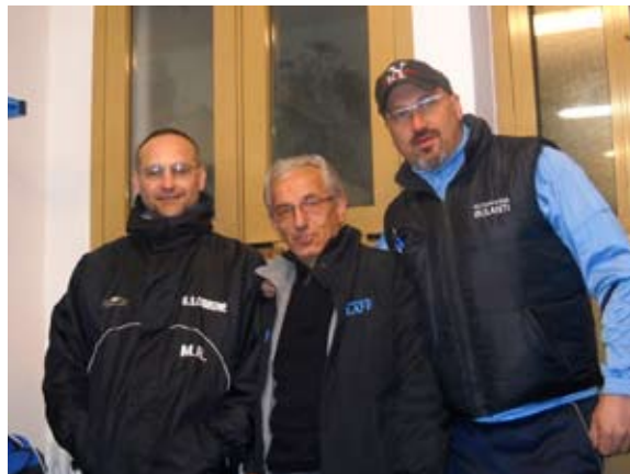
ALCUNI RAPPRESENTANTI DEL G.S.CIBRONE

attaccamento al paese, che questo gruppo riesce ad esprimere attraverso i colori bianco-verdi. Gli amici del Nibionno desiderano rimanere nell'anonimato perché si sentono di appartenere tutti in ugual modo all'a.s.d. Nibionno; sono comunque conosciuti in paese perché gravitano attorno alla società praticamente dalla sua fondazione.