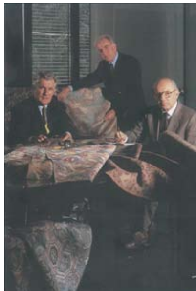
I FRATELLI FUMAGALLI

fronteggiare le richieste di un mercato sempre più esigente e per avere un elevato controllo qualitativo unito a un'ottimale gestione quantitativa dei filati tinti. La continua ricerca di un prodotto qualitativamente ed esteticamente all'avanguardia, interamente prodotto in Italia nei propri stabilimenti hanno reso in pochi anni Imatex un gruppo industriale prestigioso e competitivo, molto attento alle normative che