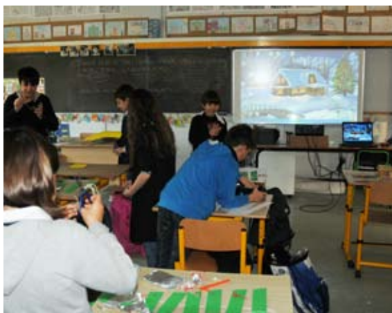
IN CLASSE ALLE SCUOLE ELEMENTARI