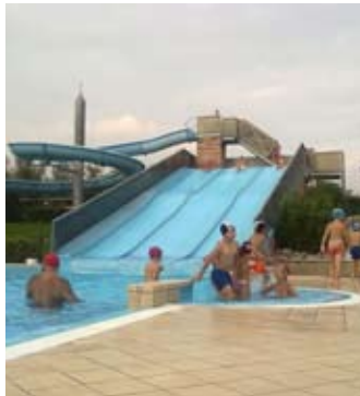
PISCINE DI GAGGIO