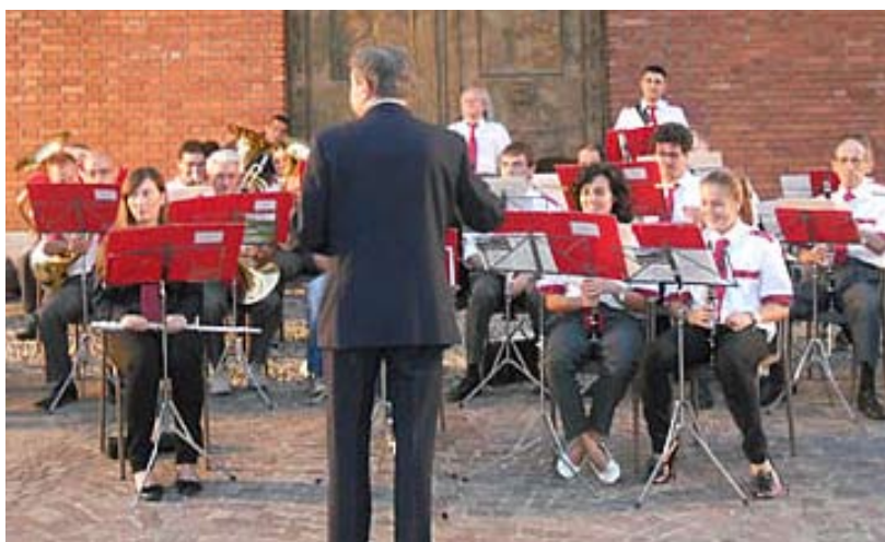
IL CORPO MUSICALE DI NIBIONNO