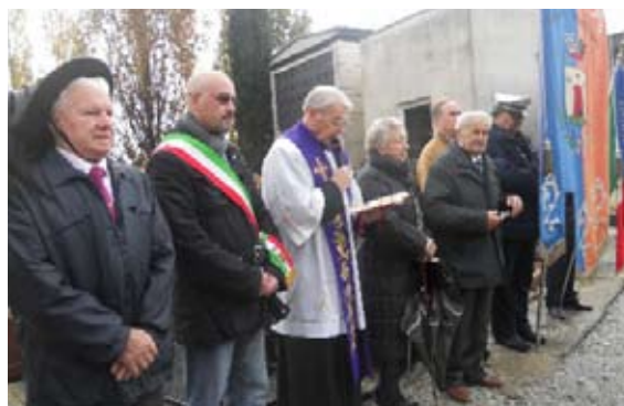
93° ANNIVERSARIO DELLA VITTORIA DEL 15/18

Nella mattinata di domenica 6 NOVEMBRE c.a., si sono svolte le celebrazioni per la ricorrenza del 93° ANNIVERSARIO DELLA VITTORIA 1915/1918. GIORNATA DELLE FORZE ARMATE.