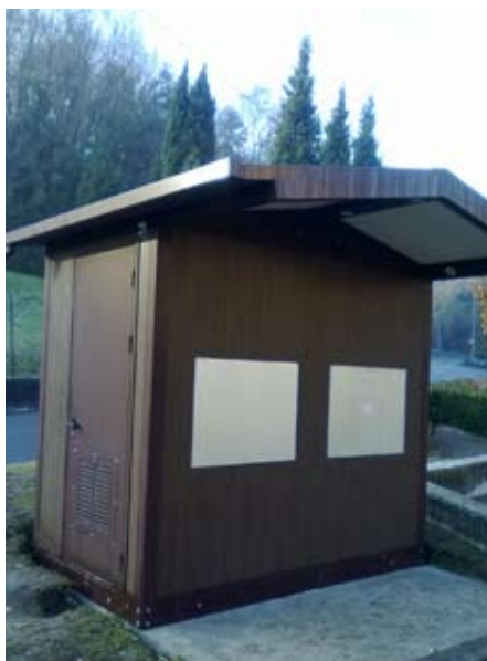
LA CASA DELL'ACQUA DI CIBRONE

Molti cittadini hanno già avuto modo di conoscere e di frequentare la Casa dell'acqua, una vera e propria casetta dove è installato un impianto di produzione ed erogazione dell'acqua potabile, facilmente accessibile a tutti coloro che desiderano gustare sul posto un bicchiere d'acqua refrigerata frizzante o che desiderano riempire una o più bottiglie da portarsi a casa. La prima casetta, sorta presso i giardini pubblici di via Diaz a Nibionno, ha avuto un riscontro positivo sia in termini di affluenza da parte dei cittadini, sia come impatto ambientale; l'obiettivo era, infatti, quello di sensibilizzare i cittadini verso un uso più consapevole dell'acqua e di riuscire in termini economici a ridurre le spese circa lo smaltimento dei rifiuti. Obiettivi, questi, che sono stati raggiunti con estrema semplicità grazie alla “complicità” dei cittadini che giornalmente utilizzano questo servizio, e si garantiscono un significativo ri-