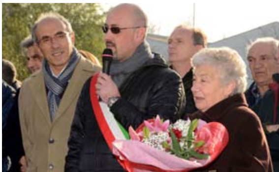
INAUGURAZIONE CENTRO SPORTIVO DI GAGGIO

La realtà sportiva nibionnese è piuttosto viva e caratterizzata dalla presenza nelle più note discipline: nel calcio con l'A.S. Nibionno, nella pallavolo con la "Pallavolo Nibionno" e nel basket con il "Basket Nibionno". Per ora ci limitiamo a segnalare due importanti novità quali il ritorno del settore giovanile nel mondo del calcio nibionnese, da troppi anni assente, e il gemellaggio della nostra società di volley con quella di Barzago. Nei prossimi numeri dedicheremo il giusto spazio a queste associazioni arricchite anche da risultati ed informazioni relative alla prima fase dei vari campionati che hanno avuto inizio in autunno. È, inoltre, intenzione della redazione creare una rubrica in cui valorizzare un personaggio significativo della vita sportiva di Nibionno.