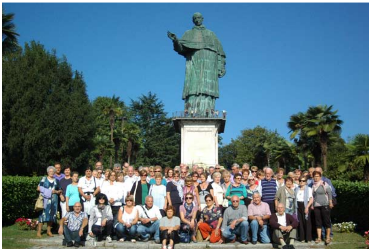
I PENSIONATI AI PIEDI DELLA STATUA DI SAN CARLONE AD ARONA