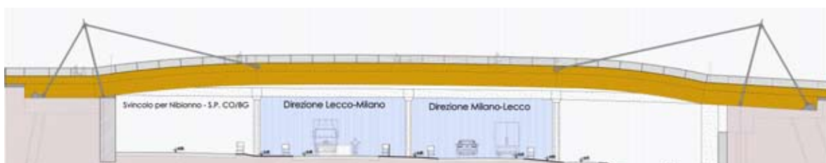
PROGETTO PER LA FUTURA PASSERELLA PEDONALE

A breve avranno inizio i lavori per la sistemazione di Piazza Parini a Nibionno come da convenzione fatta con la società “Cicli Conti”. Nel corso dell'anno 2012, il comune inizierà i lavori di rifacimento della piazza (già finanziati) per quel che gli compete, come da progetto approvato dalla precedente Amministrazione.