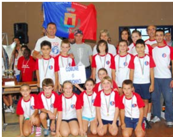
IL GRUPPO DEL COMUNE DI NIBIONNO

In conclusione il progetto è piaciuto, nonostante questa prima edizione sia stata in parte penalizzata dal maltempo. Dunque, appuntamento al prossimo anno per strappare lo scettro alla formazione del Lomagna, con la speranza che il tempo sia più clemente.