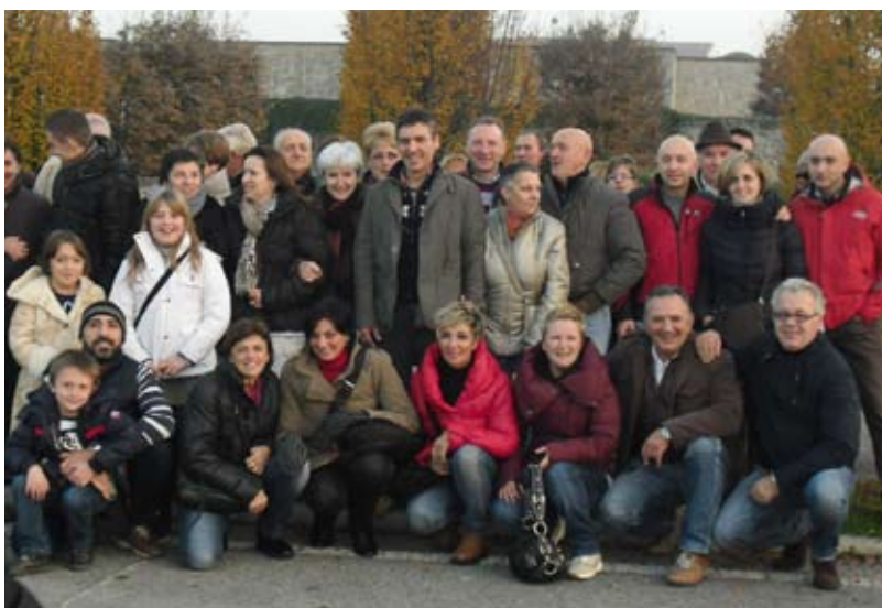
I NIBIONNESI NELLE LANGHE

Nel pomeriggio per concludere degnamente il viaggio, ci siamo diretti verso il cuore di questa terra, la città di Alba dove abbiamo avuto a disposizione un'oretta per scoprire il centro storico. Era l'ultimo giorno dell'annuale fiera del tartufo, ma i tempi erano talmente ristretti che abbiamo dovuto resistere alla tentazione di entrarvi. Per la cronaca, la nebbia ci ha accompagnato anche nel viaggio di ritorno ma ha impensierito solo l'autista perché noi ci siamo goduti un bel film fino a casa.