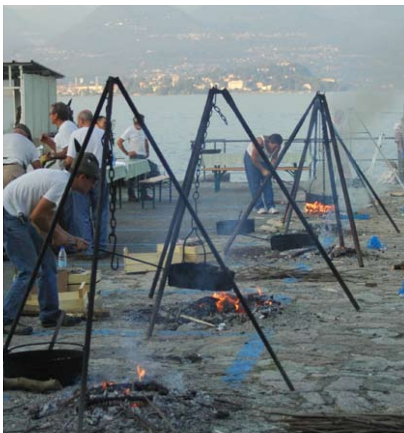
LE CASTAGNE DI STRESA

far socializzare tra di loro i partecipanti. Il pomeriggio ha visto il trasferimento a Stresa, di fronte al golfo Borromeo: oltre alla visita della città chi ha voluto ha potuto fare un'escursione con il battello sulle Isole Borromeo gustando uno dei paesaggi più suggestivi della nostra bella Italia. La giornata è velocemente volta al termine e verso le 19 i pullman hanno ripreso a bordo i nostri pensionati che sono rientrati a Nibionno, forse stanchi, ma sicuramente felici. L'Amministrazione comunale ringrazia per la numerosa e calorosa partecipazione all'iniziativa proposta.